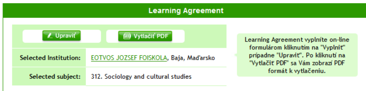
Obr. č. 3: Elektronický formulár

V prípade elektronického formuláru (obr. č. 3) kliknite na „Vyplniť“ alebo „Upraviť“, zobrazí sa formulár k vyplneniu. Formulár po vyplnení uložte kliknutím na „Uložiť“. Po uložení si môžete zobraziť alebo vytlačiť PDF formát prihlášky.