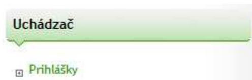
Obr. č. 2: Prihlášky

Po uložení osobných údajov kliknite na „Prihlášky“ v menu „Uchádzač“ (obr. č. 2).